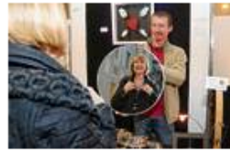
Beratung, Gespräch, freundlicher Kontakt auf dem Gmünder Kunstbasar.