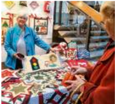
Kunsthandwerkliches steht zum Verkauf - und nicht nur Weihnachtsliches.

Er gehört zur Vorweihnachtszeit wie der Duft von gebrannten Mandeln, Maronen oder Lebkuchen der Gmünder Kunstbasar. Bereits zum 36. Mal öffnet er in diesem Jahr am Samstag, 7. Dezember, und Sonntag, 8. Dezember, jeweils ab 11 Uhr seine Pforten und verwandelt das Kulturzentrum Prediger in ein Schaufenster für hochwertiges Kunsthandwerk.